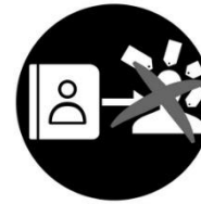
refus de profilage

Vous avez le droit à consulter vos données personnelles, les corriger, les effacer, les limiter dans le traitement, les transmettre à un autre responsable de traitement, faire une objection contre le traitement et refuser une prise de décision automatique.